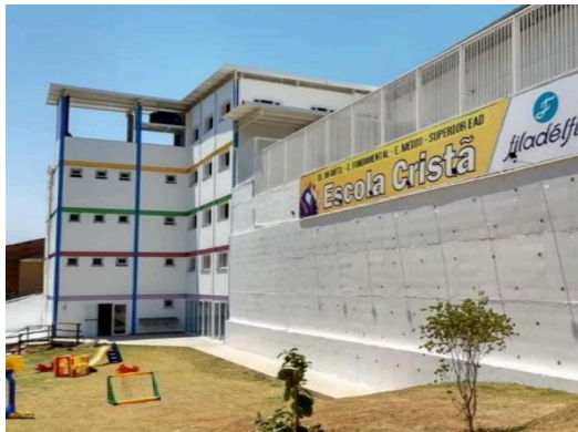
Imagem 2: Instituto Educacional e Cultural Filadélfia