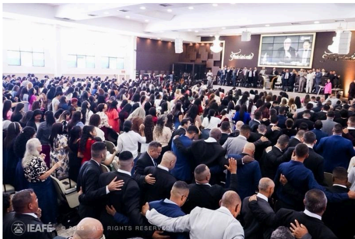
IEAFE – RENAFAE