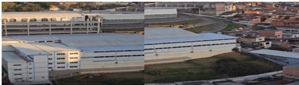
Imagem 3 – IEAFE acima e Instituto Filadélfia abaixo Imagem 4 – IEAFE e periferia ao redor

pentecostalismo 189 popular nas periferias brasileiras. Diferentemente das Assembleias de Deus tradicionais, que já possuíam mais de seis décadas de existência, a IEAFE assumiu desde sua origem uma postura que combina práticas litúrgicas clássicas com inovações estéticas e doutrinárias como veremos a seguir.