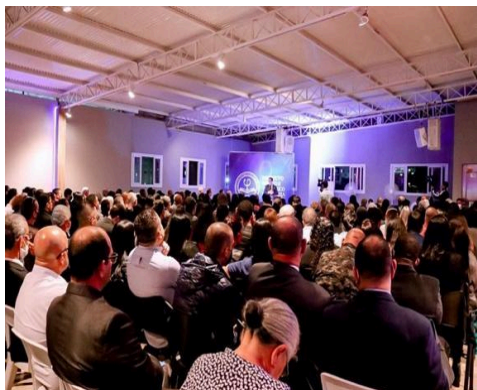
Imagem 1: Instituto Bíblico e Teológico Filadélfia