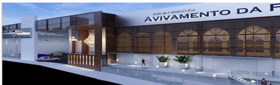
Imagem 2 – Fachada da IEAFE